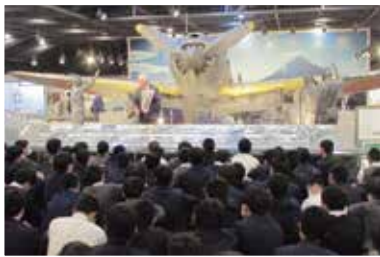
語り部による 講話の様子