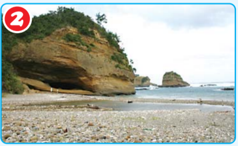
犬城海岸（马立岩屋）