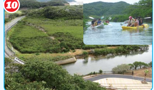
水笔仔自生地（红树林）